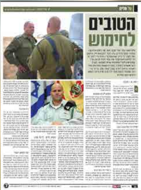
בה"ד 20 בתקשורת