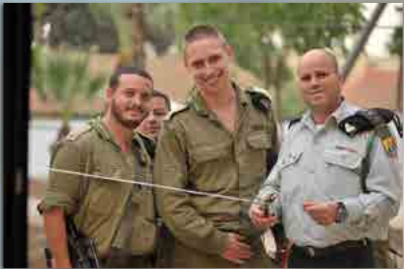
חניכת מתקן החרדים החדש לקראת המעבר לקריית ההדרכה