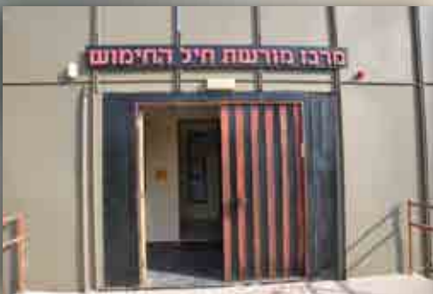
הכניסה לחדר המורשת

מתחם הספרייה הוא אולם המכיל 60 מקומות ישיבה להרצאות ולפעילויות בתחום הזהות והמורשת, כגון ערבי מורשת קרב, ערבי הנצחת חלל ושיחות של ותיקי החיל לסגל ולחניכים.