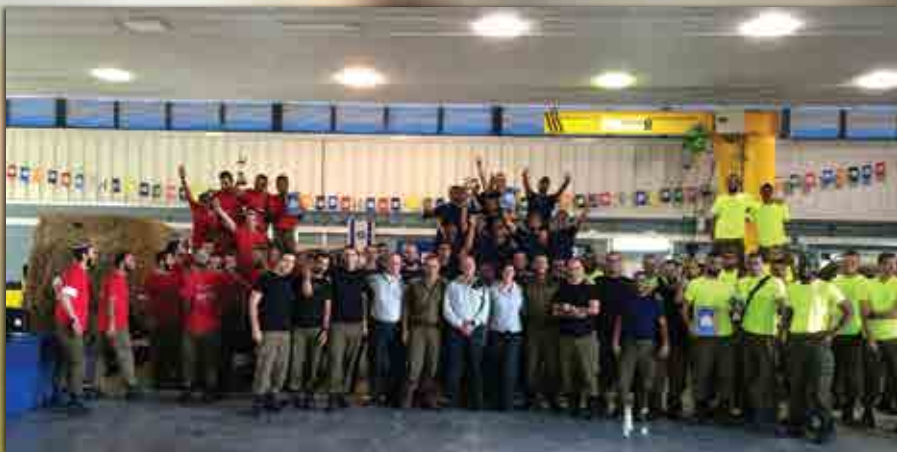
יום כשירות תחרותי במגמת אוטורניקה