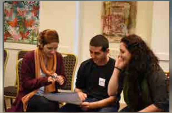
יום עיון לקצינים במסגרת תוכנית 'פסגה' בהדרכה'