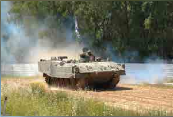
תצוגת רק"ם בבה"ד